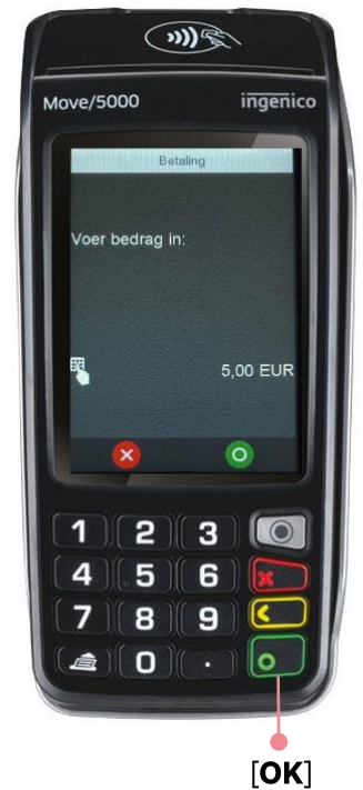
Voorbeeld geslaagde transactie